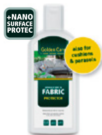
68001 Fabric Protector

0,5L - Rengjør tekstiler, puter og parasoller- og fjerner flekker og skitt på en skånsom måte.